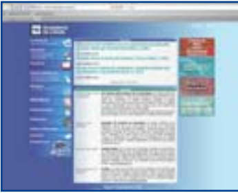
Hostaleria de Lleida fa d'Internet una extensió de les seves oficines.