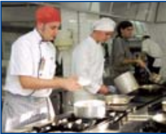
Els 12 finalistes del JC'06 van mostrar un gran nivell culinari.