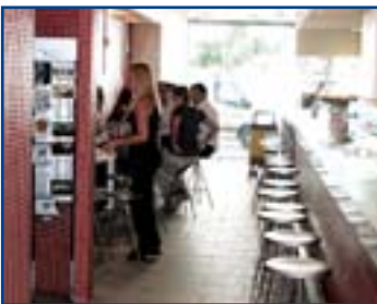
Aprovat l'avantprojecte del nou estatut pels treballadors autònoms.