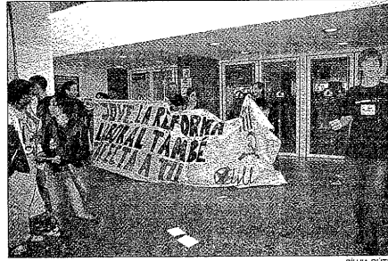
Un grupo antisistema se introdujo en los cines

se encontró con la manifestación a su paso por la Avinguda Madrid, cerca de la pasarella. Aunque pasó casi inadvertido e incluso fue saludado por el primer tramo de manifestantes, cuando llegó el turno de los delegados de los servicios a la ciudadanía, éstos llegaron a pedir su dimisión.