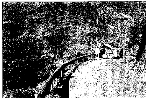
Les obres finalitzaran en quinze dies.

D'altra banda, Perelada va recordar que està a l'espera de la firma d'un conveni amb el departament de Política Territorial per a la millora de tots els accessos a nuclis.