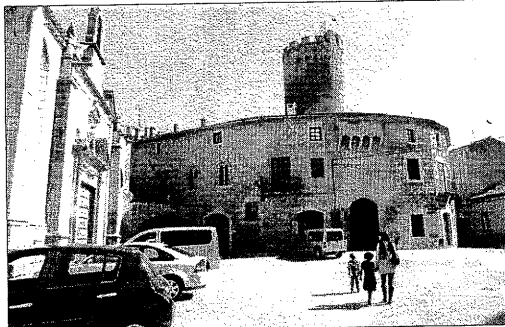
El castell de Verdú, l'edifici més emblemàtic de la població.

Després d'aquesta actuació, que tindrà un termini d'execució d'un any, el pla director projecta destinar 400.000 euros a rehabilitar la torre de guaita i instal·lar-hi els serveis d'ascensor, aire condicionat i electricitat. S'ha de recordar que al castell de Verdú s'han fet dos