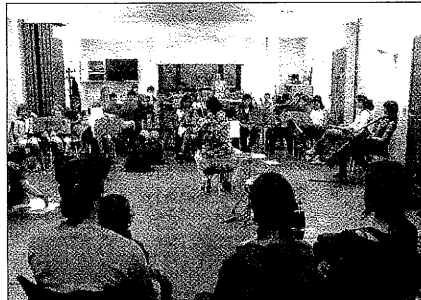
Uno de los talleres organizados por la Escola de Folk

La Escola Folk del Pirineu está gestionada por la Associació Cultural per a la Tradició Musical TRAM, en convenio con el CPCPTC, el Ayun-