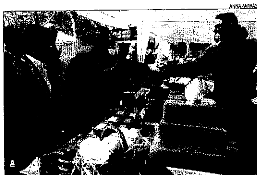
Llena i Orrit saluden els responsables d'un estand de codony.

A més d'un èxit de públic, l'organització en va destacar l'augment de paradistes, ja que es va passar dels 70 de l'edició passada a 90, la majoria