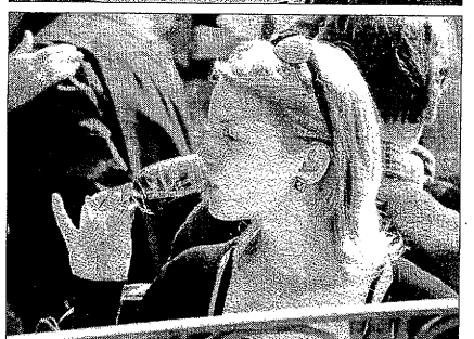
Nens i adults van disfrutar de la segona edició de la Festa del Vi en què van participar 23 cellers de la DO Costers del Segre.