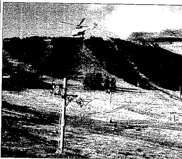
Instalan un nuevo telesilla en la estación de Espot para subir a la cota de 2.500 m

Mientras, el sector de turismo en el Pirineo ya se prepara para la llegada de la temporada de invierno que se prevé que pueda comenzar en algunas estaciones de esquí del Penedès de Puigcerdà. La llegada de la nieve en la temporada de invierno generalmente es buena para el Pirineo de Lleida. Tanto en las estaciones de esquí como el sector turístico se prepara.