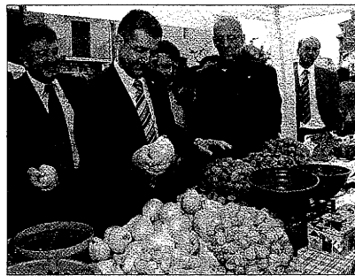
El 'conseller' Joaquim Llena visitó el recinto ferial

El alcalde de Almacelles considera de vital importancia para el aeropuerto que esté perfectamente conectado con la red de autovías y autopistas, tanto de Catalunya como de Aragón, con particular incidencia en la Franja, puesto que solamente de esta forma puede garantizarse el éxito en la explotación del aeropuerto de Lleida-Alguaire, tanto sea para viajeros co-