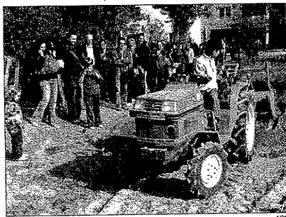
El objetivo era dar a conocer el trabajo de la zona

gas Torres de Sanui, Analec Celler La Figuera, Carvirella L'olivera, Casa Pardet Mas Blanch i Jové, Castell d'Encús Celler del Montsec, Castell del Remei Tomàs Cusiné, Celler del Montsec Celler Vila Corona, Cercavins Vall de Baldomar, Cérvoles Vinya L'hereu de Seró, Comalats Vinya Els Vilars, Clos Pons Raïmat y Costers del Sió.