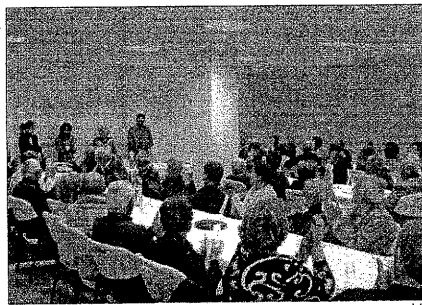
El Casal acogió la fiesta para sus socios y usuarios

esta fiesta. Esta celebración se enmarca dentro de los actos que organita la asociación en colaboración con la Secretaria d'Acció Ciutadana (SAC) del Departament de Governació, como por ejemplo el homenaje a las personas que cumplen 85 años, la fiesta intergeneracional (de abuelos y nietos) en primavera, y la "turrónada" que es celebra en