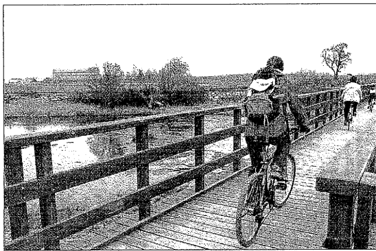
El trabajo recoge las propuestas para desarrollar el cicloturismo

El estudio, elaborado por la Fundación ECA Bureau Veritas, analiza las posibilidades que tienen el turismo y la bicicleta en Lleida. El trabajo presenta una serie de propuestas que quieren servir para mejorar el cicloturismo en el conjunto de la demarcación, tomando como base las