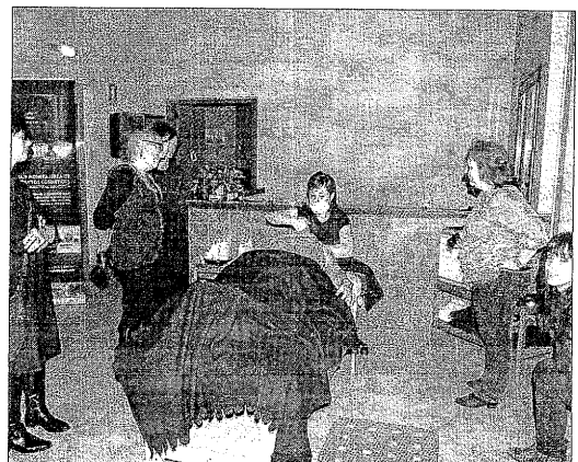
Demostració dels productes de cosmètica del caviar.

veni de col·laboració per a la promoció conjunta de les dos marques turístiques. En aquest sentit, el conseller de Torisme, Juan Antonio Serrano, va explicar que aquest acord permetrà la venda de paquets turístics que combinin les estades a Barcelona amb les escapades a la muntanya. Serrano espera rebre els primers turistes aquest estiu, ja que tour operators russos i alemanys ja han mostrat interès pel producte.