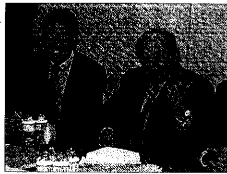
Pujol visitó ayer la capital de la Noguera

Pujol fue muy crítico con las principales formaciones políticas españolas así como con la justicia. Aunque el presidente de CDC no entró en valoraciones sobre si es positivo o no emitir una sentencia sobre el Estatut con las