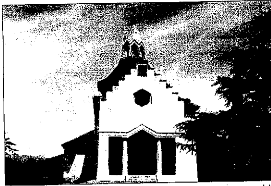
La Iglesia de Sant Antoni del Tossal, en el municipio de Alàs i Cerc

LA SEU D'URGELL • El Consell Comarcal de l'Alt Urgell, declaró en su último pleno, celebrado el pasado 9 de junio, bien de interés cultural (BIC) seis nuevos conjuntos del patrimonio inmueble de la comarca. De todos los elementos declarados, destaca la ermita de Sant Antoni del Tossal, en el municipio de Alàs i Cerc, considerada la realización más notable que el estilo modernista ha dejado en la comarca de l'Alt Urgell. Su artífice, Antoni Bergós, es uno de los más reconocidos arquitectos que trabajaron en la comarca durante el siglo XX, con proyectos tan sig-