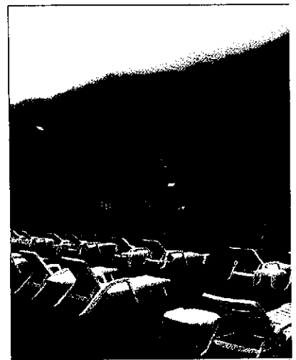
Serrano espera aumentar el nivel de ocupación del 2

Serrano explicó que de momento estas previsiones se están cumpliendo y cierran el mes de julio con un 50% de ocupación y esperan que en agosto se llegue al 70%. También aseguró que continuaran trabajando en la misma línea del año pasado.