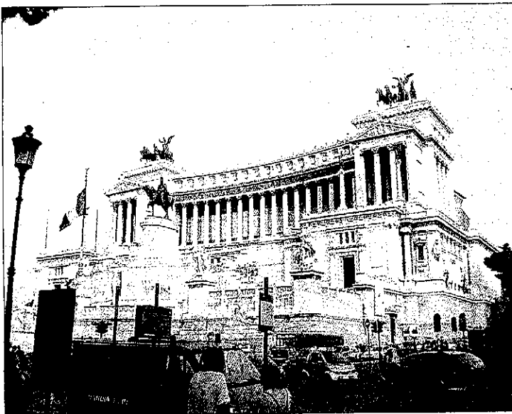
Uno de los lugares más visitados por los leridanos es Roma