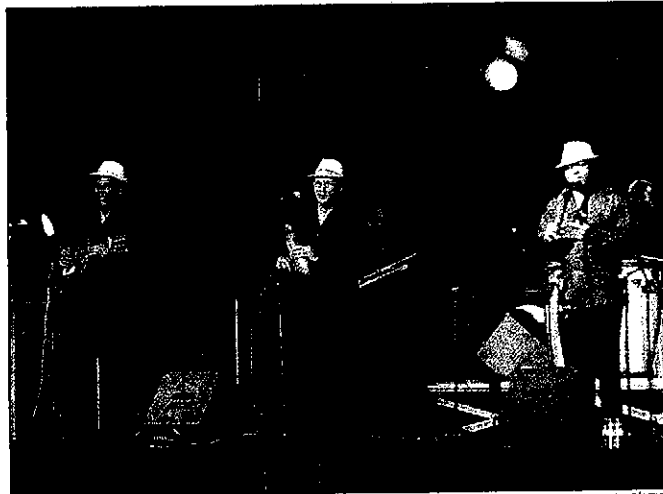
El concierto del Septeto Santiaguero es el sexto que acoge la plaza de la Llotja

baneras con Arrels de la Terra Ferma y Boira; un espectáculo de danza y arte en movimiento de Dansa Estudi; la obra El Xarlatan , de Teatre de Guerrilla; el espectáculo Canguelís , de Vol Ras, y Fosquo , de la Inestable 21. Hasta acabar el mes, se llevará a cabo en el mismo espacio dos actuaciones más. Una será The New Generations , con la que se podrá escuchar el gospel de Barcelona Gospel Messengers y el concierto de Quico el Cello, el Noi i el Mut de Ferreries.