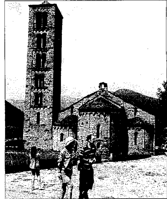
Iniciatives com el Patrimoni Mundial faciliten les marques turístiques.