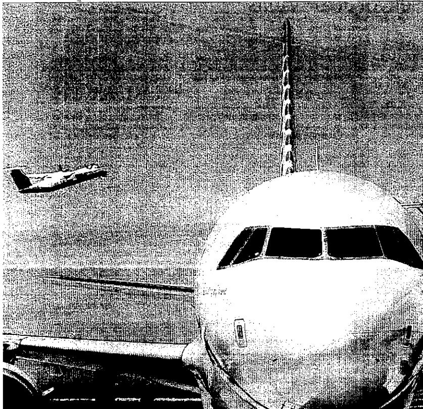
Vueling, que connecta amb París i Palma de Mallorca.

El turisme que es practica a Lleida a l'estiu ofereix tota la gamma de categories i preus, però segons la previsió de la Diputació (250 milions i 800.000 turistes aquesta temporada) l'impacte és de 312 euros per visitant.