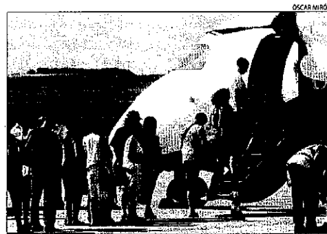
Moment d'embarcament en un dels nous vols.