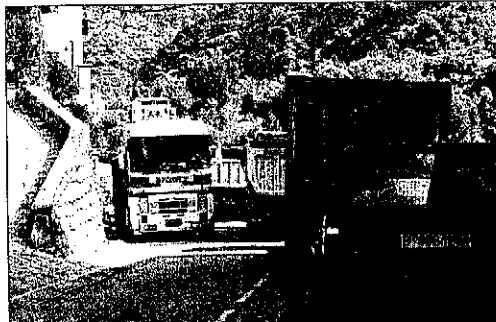
L'actual travessia de la N-260, al seu pas per Gerri de la Sal.

La ronda de Gerri de la Sal tindrà un traçat que discorrerà pel marge oest de la Noguera Pallaresa i sortirà a uns 600 metres del nucli de població pel sud. Preveu un túnel de 980 metres de longitud, un viaducte de 96 metres al tronç de la