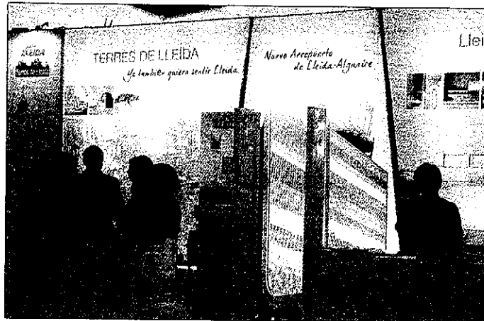
El stand Lleida en Fitur ha sido visitado por tour-operadores internacionales

Una de las grandes apuestas de Turisme de Lleida es Alemania, país con el que se ha mantenido contactos con la oficina española de turismo de Berlín y con el centro de coordinación turística de Düsseldorf para promocionar el aeropuerto. Además, el próximo mes de marzo se participará en la feria de tu-