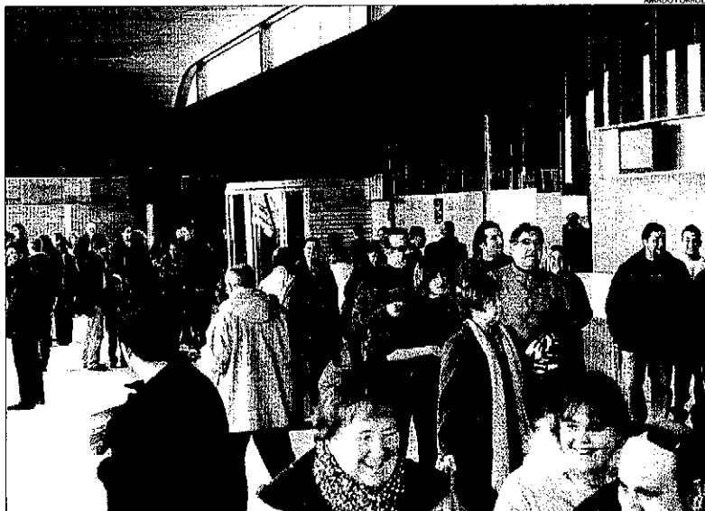
L'aeroport va rebre la visita de més de 1.000 persones en les dos Jornades de portes obertes.

A més, va comentar que el ministre de Foment, José Blanco, va dir al Congrés que per a l'estiu està previst que l'aeroport pugui actuar fora de l'espai Schengen. "A més, la nostra