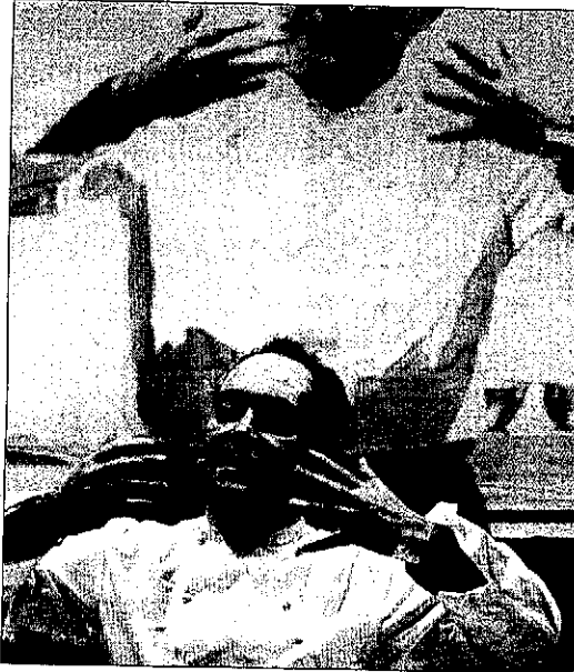
Adrià està considerat un dels millors cuiners del món.

La decisió té, a més, un component personal. "No sé estar sense fer res, però també ens mereixem normalitzar les nostres vides després de 25 anys", va comentar. "Està clar que quan tornem no serà igual. Però no seran anys sabàtics", va afegir.