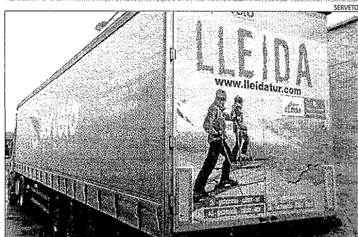
Camions de l'empresa Serveto llueixen imatges de gran format.

Situada en un emplaçament privilegiat, es presenta com un atractiu punt de trobada i relax després de la jornada esportiva, desplegant una oferta hivernal centrada en delicioses begudes calentes i gelats amb pastisseria.