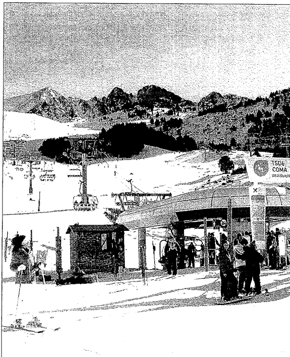
Grandvalira termina el año con 90 pistas abiertas y cuatro snowparks

Según la página web especializada AllTheSki.com , Sunset Park constará de dos zonas, una con dos lomas que pueden permitir saltos de hasta 17 metros de plano y otra con varias líneas de rails y saltos de iniciación, que irán variando durante la temporada. Además, contará con