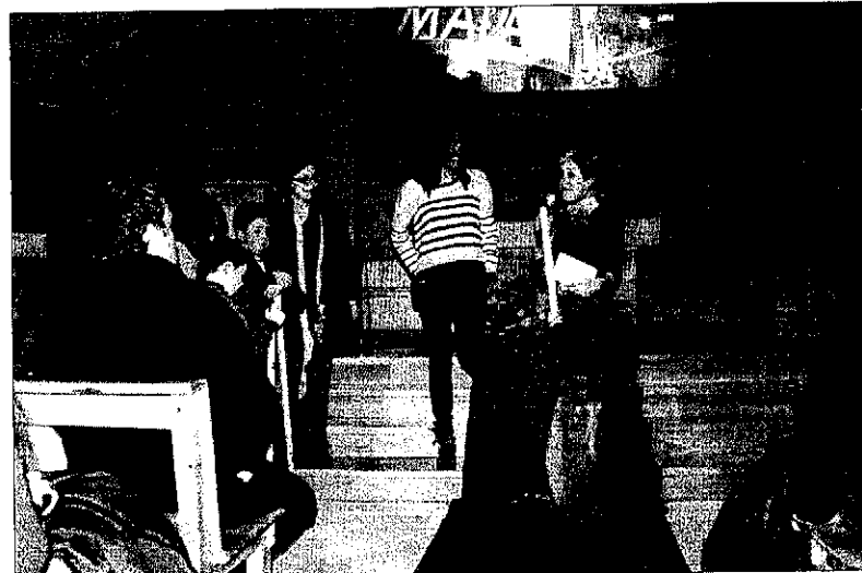
La conferència de l'alpinista Edurne Pasaban, ahir a Aran.