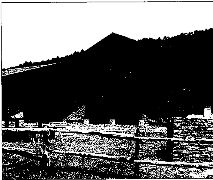
Imposible encontrar alojamiento en las casas rurales de l'Alt Urgell para fin de año

Los "alojamientos de cama" son aquéllos en que la casa ofrece al huésped todos los servicios como las comidas