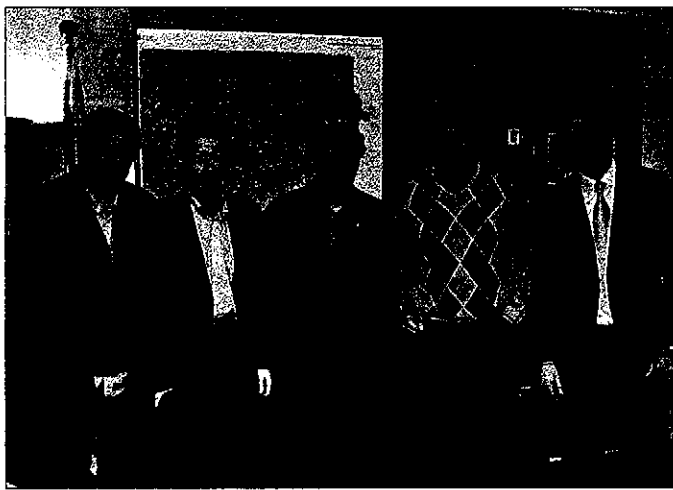
Los representantes del sector del ocio se reunieron ayer con el delegado del Govern

Por otro lado, las discotecas esperan también que se repita la afluencia de clientes. No obstante, este año la celebración nocturna viene marcada por la prohibición de hacer barras libres de acuerdo con la normativa de Salud