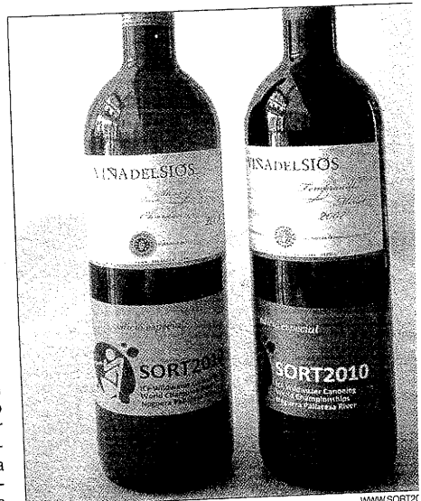
El vino ya luce el etiquetado alusivo al Mundial