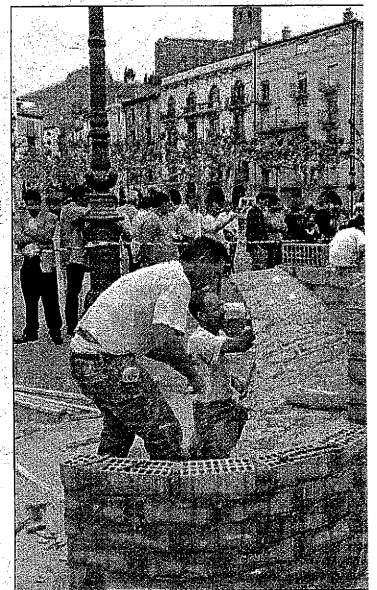
El Concurs de Paletes es farà diumenge al nou recinte

Les coques elaborades per a aquesta Mostra, que està organitzada per la Societat Gastronòmica i Cultural del Comtat d'Urgell, es podran assaborir durant els dies de fira amb un tiquet que donarà dret a dos talls de coca, un café, i una cervesa i amb el número del tiquet s'entrarà en un sorteig d'un electrodomèstic.