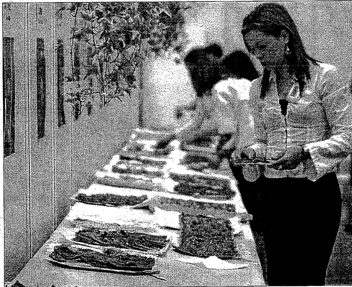
Un total de divuit forners presentaran les seves coques a la Fira de Balaguer

També cal afegir que s'està treballant, paral·lelament, en la creació d'una marca de qualitat per a aquesta coca de samfaina, que de ben