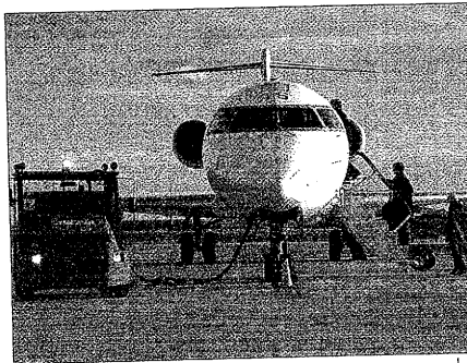
Pyrenair se incorpora a la oferta del aeropuerto de Lleida

es decir no vinculados a los paquetes de esquí, tendrán unos precios que rondarán los 98 euros ida y vuelta. Los paquetes de esquí, además del vuelo, incluirán el transporte en autocar hasta la estación de esquí, las dos no-