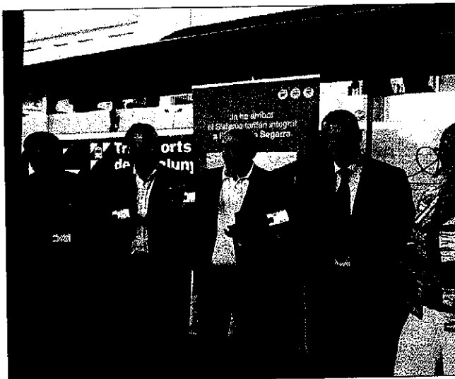
La estación de Cervera fue uno de los puntos en los que se presentó la ampliación

La ATM tiene previsto establecer, en las dos nuevas comarcas, unos 40 puntos de venta y recarga de las tarjetas que permiten a los usuarios de transporte público viajar en los servicios interurbanos, en los autobuses de la red de Lleida ciudad y en los Ferrocarrils de la Generalitat con importantes descuentos. Así, por ejemplo, un vecino de Cervera podrá ir a Lleida por 1,17 euros, cuando actualmente tiene que abonar cerca de 7 euros si viaja en autocar o 3,50 si lo hace en tren, y de Cervera a Tàrrrega por 0,76 euros con una T-10. La rebaja es fruto del esfuerzo de las administraciones locales que forman parte actualmente la ATM y de la Generalitat de Catalunya que aporta el 85% de su presupuesto. A la vez, los municipios adheridos realizan una aportación que, en este 2010, es de 0,87 euros por habitante y año, y en su parte proporcional de lo que