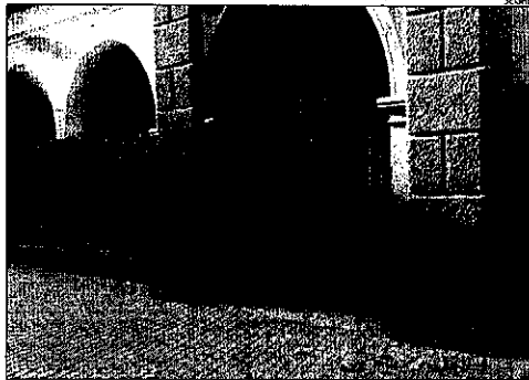
Divendres passat van caure fragments de la façana de l'edifici.