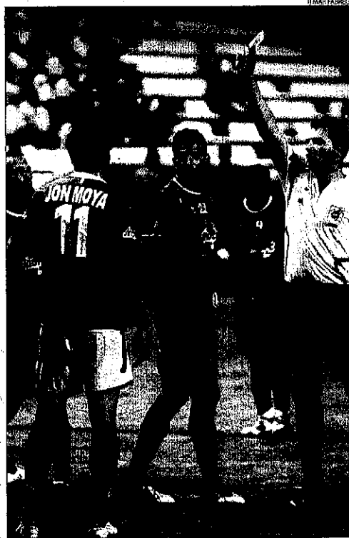
Al final del partit hi va haver una petita tangana per aquesta targeta.