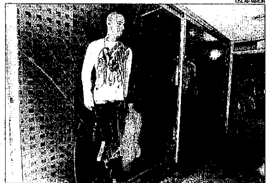
Els lladres van trencar ahir el vidre de l'aparador per quarta vegada.