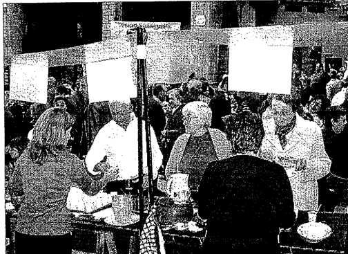
La Fira del Bolet de la comarca, en l'edició de l'any passat.

| SOLSONA | La Fira del Bolet i el Boletaire de Solsona arriba a la tercera edició aquest cap de setmana. Una xerrada sobre les plantes aromàtiques de la comarca i la cuina catalana obrirà avui els actes del programa, que continuarà demà dissabte amb el Mercat del Bolet i Productes Artesanals del Solsonès a la plaça Major i la plaça de l'Església. A la tarda s'inaugurarà l'exposició fotogràfica Tota una vida-recull de fotografies del 1914 al 1977 del Solsonès , a càrrec de Joan Mondragón i Montse Sallent; així com les VI Jornades Gastronòmiques de Tardor del Solsonès, que permetrà als assistents degustar els productes locals elaborats per cuiners del Gremi d'Hostaleria del Solsonès. El tiquet té un preu de 5 euros i inclou quatre degustacions. De les 18.00 hores a les 20.00 hores el Grup Natura del Solsonès organitza una visita