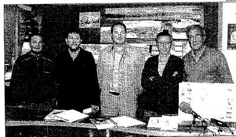
Acord per a la promoció turística ■ El Patronat de Turisme del Solsonès i el de la vall de Lord han firmat un acord de col·laboració econòmica per a l'any que ve.

com la impressió que es genera quan el client veu el comerciant per primera vegada, la importància de saber escoltar, com es treballa en les èpoques en què baixen les vendes i com potenciar la lògica, la creativitat i la intuïció en les vendes. Aquestes dos activitats es porten a terme gratis i estan dirigides al públic interessat i sensible a aquests temes.