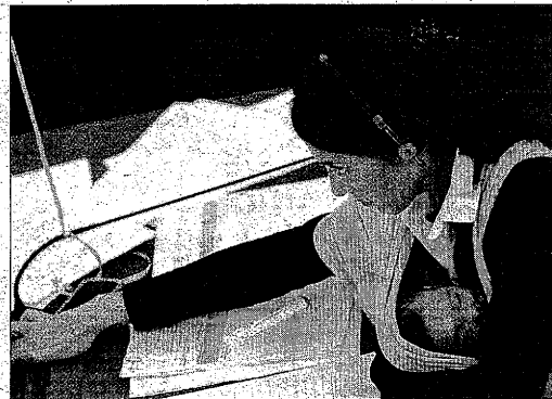
Una parlamentària amb el seu fill durant la votació.

Finalment, els eurodiputats van decidir anar més enllà de la proposta inicial de la Comissió Europea, que advocava per 18 setmanes, i atansar la baixa al període de 24 setmanes que recomana l'Organització Mundial de la Salut (OMS). "El vot del Parlament en la seua primera lectura és molt ambiciós, però està clar que no facilitarà un compromís equilibrat amb el Consell a curt termini", va opinar després de la votació la vicepresidenta de l'Executiu comunitari Viviane Reding. Les paraules de la comissària adverteixen de l'oposició que espera als diputats al Consell de Ministres de la Unió Europea, on alguns països com el Regne Unit i Alemanya s'oposen totalment a l'ampliació de la bai-