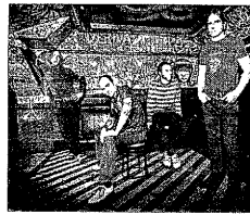
El grup Los Coronas.