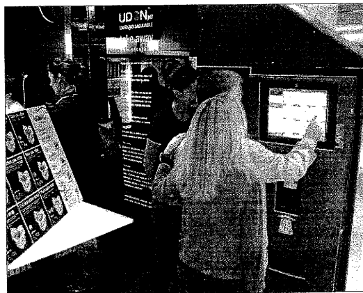
Els comensals fan la comanda directament sense fer cues.

[BARCELONA] El Grup UDON ha obert a Barcelona Udon Ya, un fast food de menjar asiàtic que agilitza el servei i estalvia temps als comensals amb el punt de venda desassistit ICGKiosk, desenvolupat per la multinacional lleidatana ICG Software amb el qual el mateix client realitza la comanda dels plats sense que hagin de fer cues d'espera al no haver-hi intermediaris.