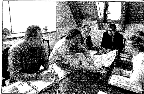
La reunió per recuperar el Camí de Sant Jaume a Aran.

La recuperació del Camí de Sant Jaume s'uneix a la iniciativa del Conselh per crear un camí transfronterer de l'art romànic amb la regió de Comenges i les comarques de la Ribagorça catalana i d'Osca. Aques-