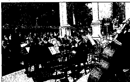
La Banda Municipal de Lleida amenizó la jornada