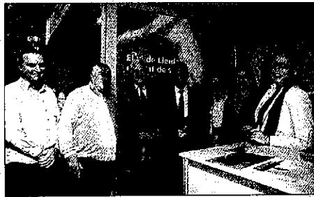
Las autoridades saludaron al Celler Torres de Sanui