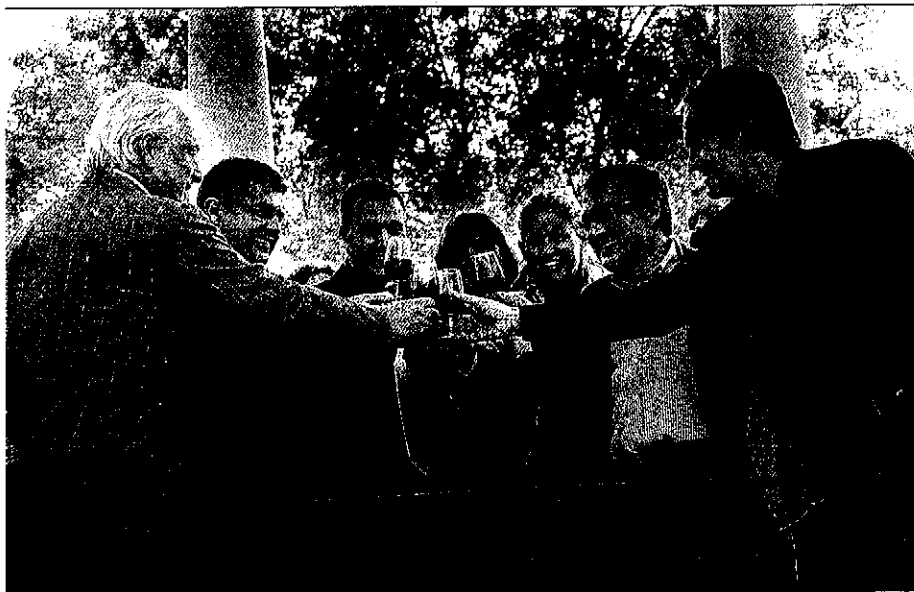
Las autoridades inauguraron la festividad brindando con vino de Costers del Segre