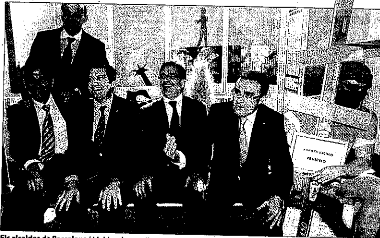
Els alcaldes de Barcelona i Lleida, el conseller Ausàs, Gilabert i Pueyo, al banc calafactor de la Fira.

LLEIDA | El nou pla Zapatero aportarà 46 milions d'euros a les seques arqués municipals lleidatanes per a projectes i inversions que primin les energies alternatives, la tecnologia i l'acció social i que podrien crear un miler d'ocupacions a Lleida.