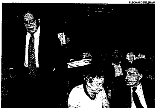
Jordi Pujol puja a l'estrada just pel costat de la seua dona.

D'altra banda, va recordar que va voler concedir Veterinària a Lleida per qüestions d'equilibri territorial, com va fer amb Agrònoms i també amb