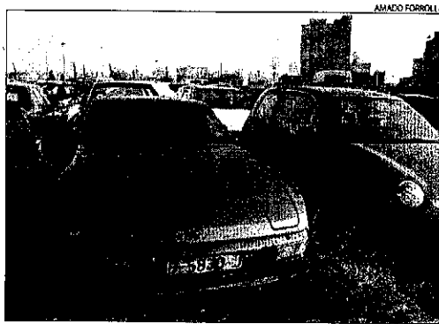
El Porsche que l'ajuntament ha posat a la venda.