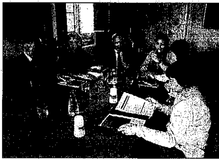
La entidad actuó tras una información de LA MAÑANA