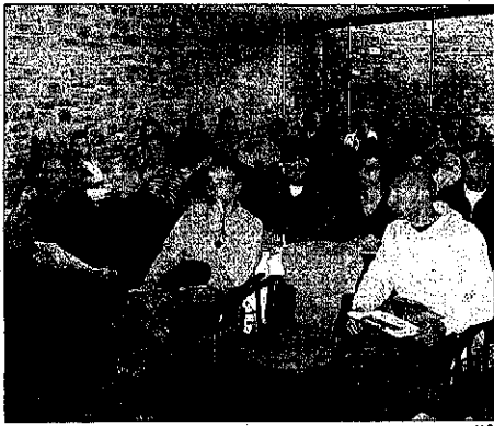
La sede del Consell Comarcal acogió la primera sesión

EL PONT DE SUERT N. C. Las jornadas de formación turística de Ribagorça Romànica se inauguraron ayer en el Pont de Suert y cuentan con la participación de 34 empresarios y empresarias ligados al sector relacionado con el turismo de naturaleza y el senderismo. La sede del Consell Comarcal de l'Alta Ribagorça acogió la primera jornada de trabajo, que proseguirá hoy en Areny y Serrate, y que finalizará el día 11 de noviembre en el Centre del Romànic de Eril-la-vall y Roda de Isábena. Las jornadas constarán de temario teórico y práctico a cargo de técnicos especialistas en turismo rural.