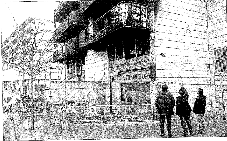
Retiren rajoles calcinades de l'edifici de Cappont ■ Una empresa constructora va començar ahir a retirar les rajoles calcinades de la façana del número 10 del carrer Pere Cabrera després de l'espectacular incendi de diumenge. Els veïns de la primera planta tardaran dies a tornar-hi.

LLEIDA | Un fals agent de la Policia Nacional va assaltar ahir una dona al carrer Comerç. Segons sembla, l'home es va identificar com a policia i va demanar a la dona la documentació. Quan aquesta va obrir la bossa, li va robar la cartera i després va fugir corrent. L'home va utilitzar el mateix mètode d'un altre lladre que va assaltar una dona al carrer Alfred Perenyà.