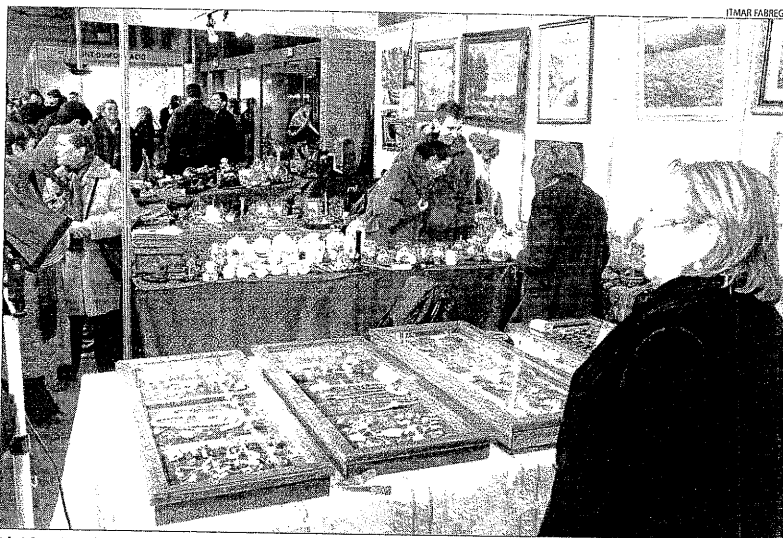
Lleidantic i Lleida Retro van tancar ahir les portes amb menys visitants que en l'anterior edició.

Lleidantic ha exposat més de 10.000 peces en 48 estands d'una vintena de sectors i algunes eren aptes per a totes les butxaques. El visitant hi ha trobat