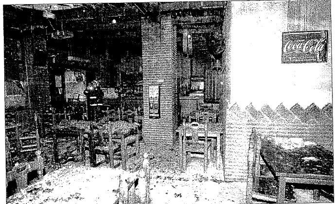
Un bomber va revisar ahir part del Frankfurt Lübeck, que va quedar arrasat pel foc.