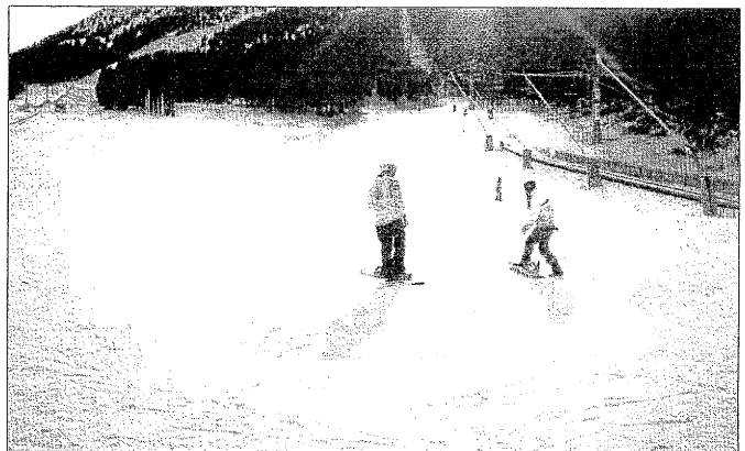
Comença la temporada al Pirineu. A l'esquerra, esquiadors a la cota 2000 de Cerler. A la dreta, a dalt, clients al nou telecadira de Baqueira i, a baix, Port del Comte.