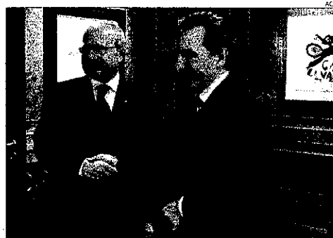
José Montilla i Jaume Bartumeu, durant la trobada.