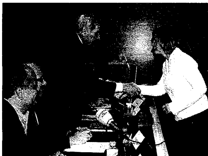
Maragall entregó ayer los diplomas a los alumnos del instituto de la Pobla de Segur

LA POBLA DE SEGUR El conseller Ernest Maragall, presidió ayer la clausura del curso de ciclos formativos de grado superior de esquí alpino y surf de nieve que se imparten en el instituto de la Pobla de Segur. Se trata de la primera vez que 21 estudiantes se gradúan en estas especialidades en un centro público del Departament d'Educació y en todo el país.