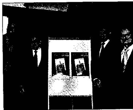
Ambos salones tendrán lugar este fin de semana

(300 más que en la edición anterior) y reunirán a 45 expositores, seis menos que el año pasado. Entre los expositores de este año destaca la presencia de profesionales de toda Catalunya, Valencia, Aragón, la Rioja y hasta de Francia. Entre las novedades de este año, el alcalde de Lleida, Àngel Ros, destacó la expo-